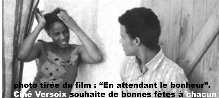
photo tirée du film : "En attendant le bonheur". Ciné Versoix souhaite de bonnes fêtes à chacun

CinéVersoix est une activité d'Ecole & Quartier